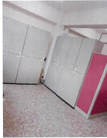
會談/諮商/團體活動室