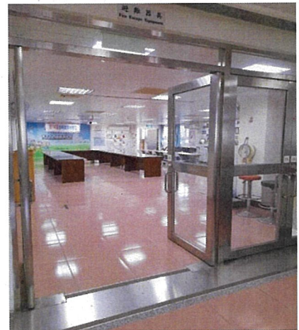
辦公室/無障礙電梯/心衛中心多功能室