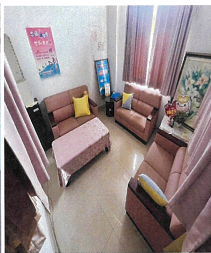
辦公室/多功能室/會談、諮商空間